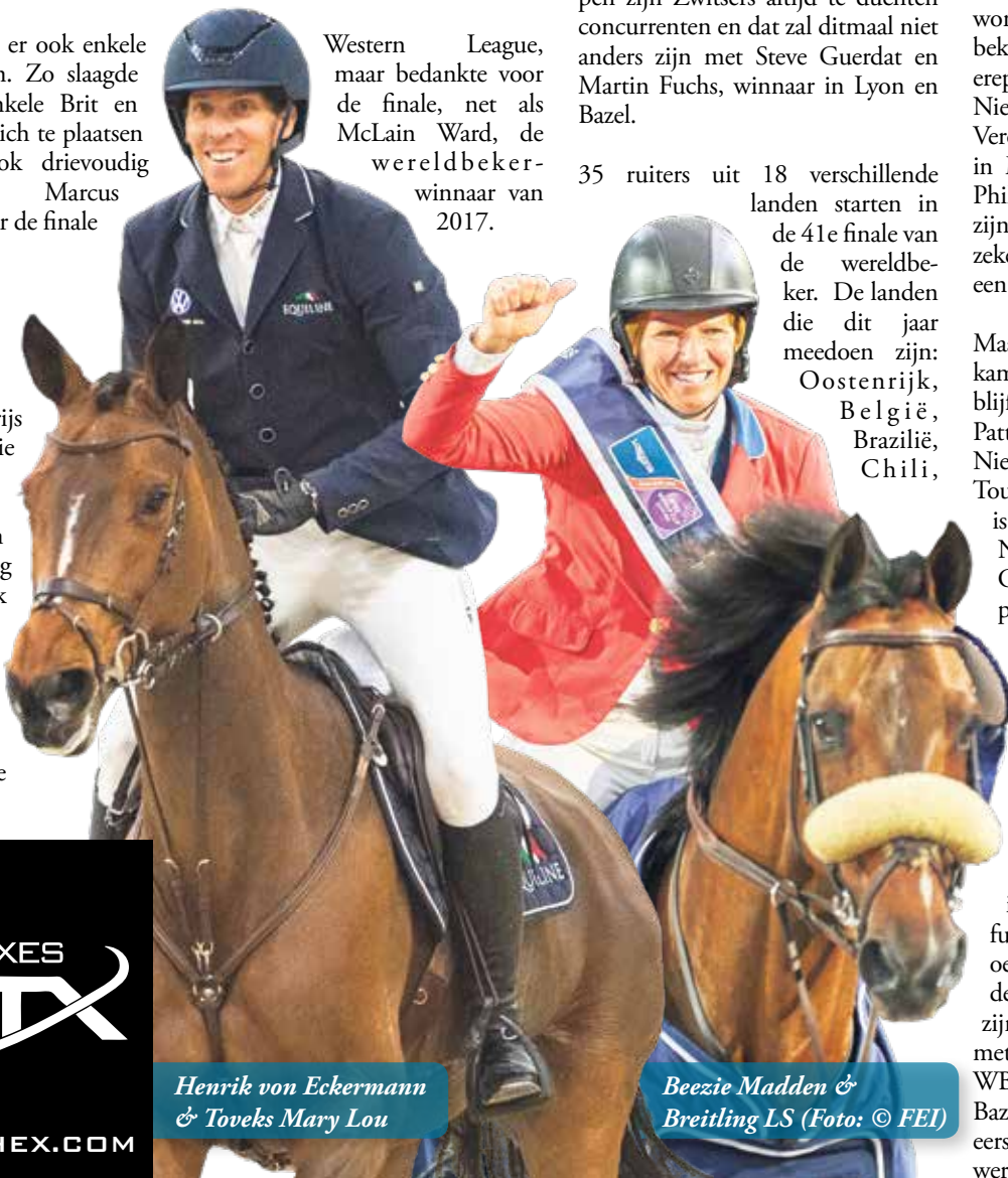
Henrik von Eckermann & Toveks Mary Lou